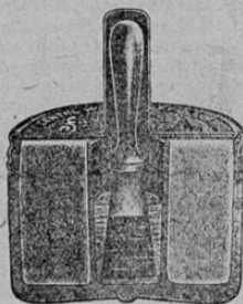
Corte a través para mostrar el sistema